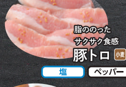
脂ののった サクサク食感 豚トロ 小麦 塩 ペッパー