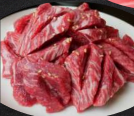
特製ダレが絶品。 ヘルシーロース 赤身パワー ロース 小麦 タレ オニオン