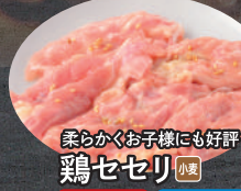
柔らかくお子様にも好評 鶏セセリ 小麦 タレ 塩 ミネコ