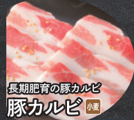
長期肥育の豚カルビ 豚カルビ 小麦 タレ 塩 ミネコ