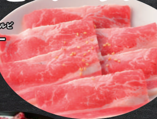
タレ 塩 ミネコ