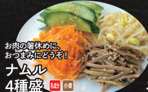
お肉の箸休めに、 おつまみにどうぞ! ナムル 4種盛 乳成分 小麦