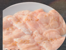
当店人気NO.1ホルモン 豚ホルモン 小麦 塩 味噌 辛味