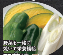
野菜も一緒に 焼いて栄養補給 野菜焼 小麦 (カボチャ・ネギ・ピーマン)