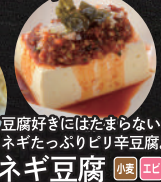
豆腐好きにはたまらない! ネギたっぷりピリ辛豆腐。 ネギ豆腐 小麦 エビ