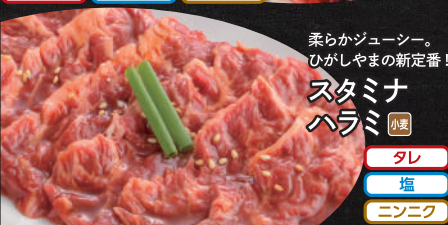
柔らかジューシー。 ひがしやまの新定番! スタミナ ハラミ 小麦 タレ 塩 ミネコ