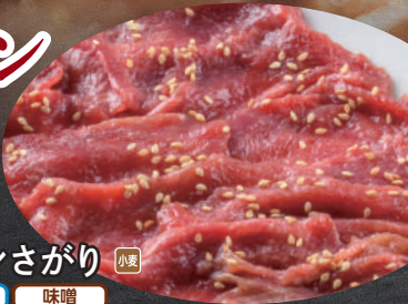
牛タンさがり 小麦 塩 味噌